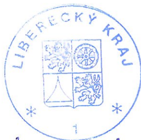
..... Martin Půta hejtman

úplnou aktualizaci dokumentace Územně analytické podklady Libereckého kraje, pořízenou k 30. 6. 2021 dle § 28 odst. 1 zákona č. 183/2006 Sb., o územním plánování a stavebním řádu, ve znění pozdějších předpisů.